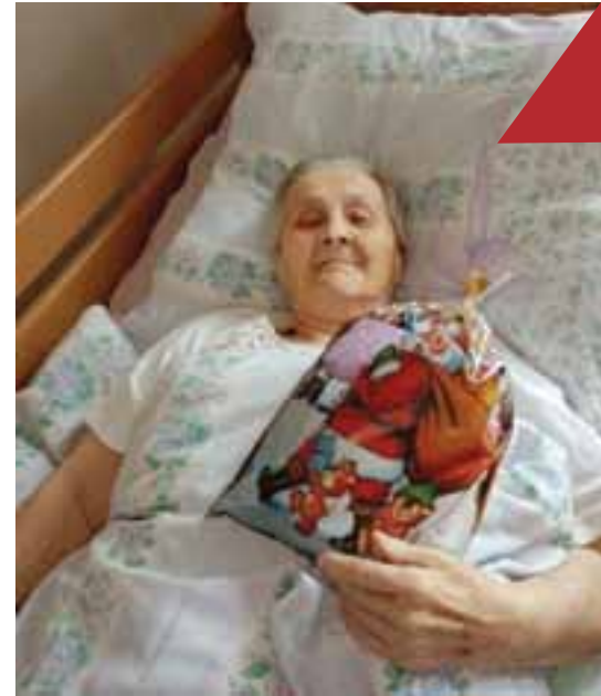
V decembri sme oslávili aj sv. Mikuláša. Naši seniori dostali mikulášske balíčky, ktorým sa potešili.