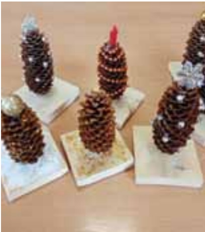
V decembri sme sa vytvárali ozdoby na stoly zo šišíek a dreva.