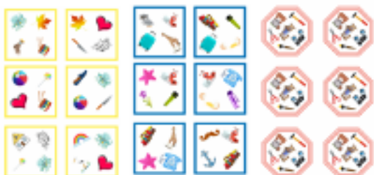
IncluDidActive kartačky Dobble Logopédia

Pracujeme tiež na množine komunikačných kartačiek, ktoré precvičujú a zdokonaľujú rôzne kombinácie pri tvorbe viet a slovnej zásoby v ranom veku dieťaťa.