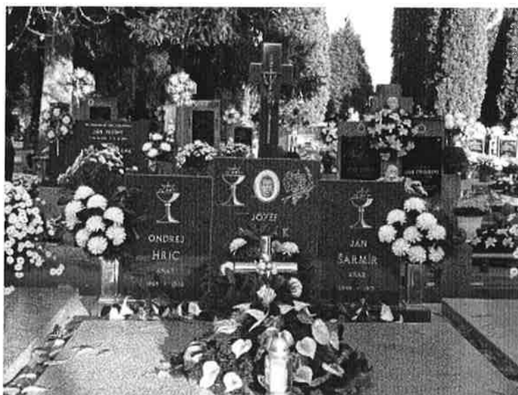
Hrob Jozefa Nováka na čajkovskom cintoríne