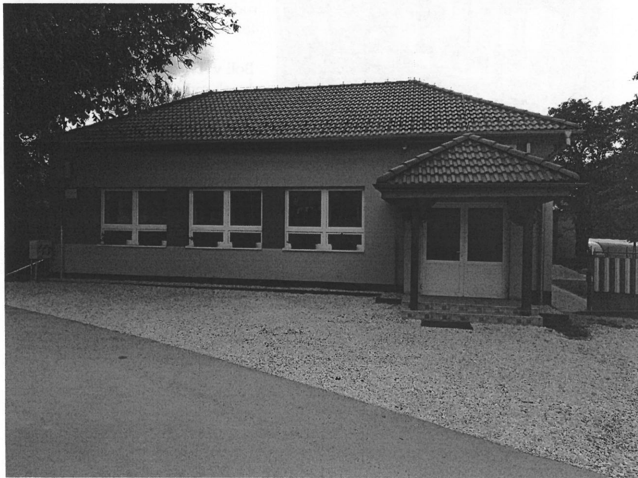
Spoločenský dom v obci Kružná