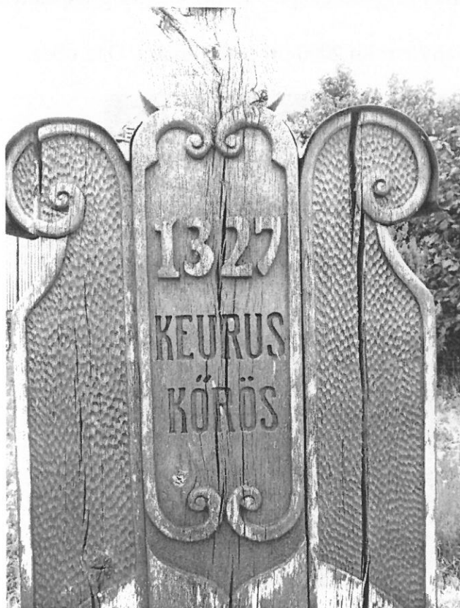
Pamätný stĺp v obci Kružná