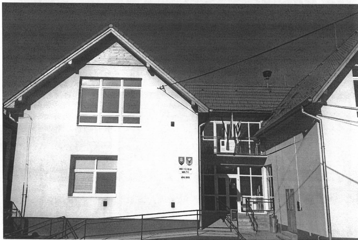
Obecný úrad v Kružnej

V súčasnosti v budove na prízemí sídli obecný úrad, a na poschodí je vytvorená remeselnícka izba a zariadená knižnica.