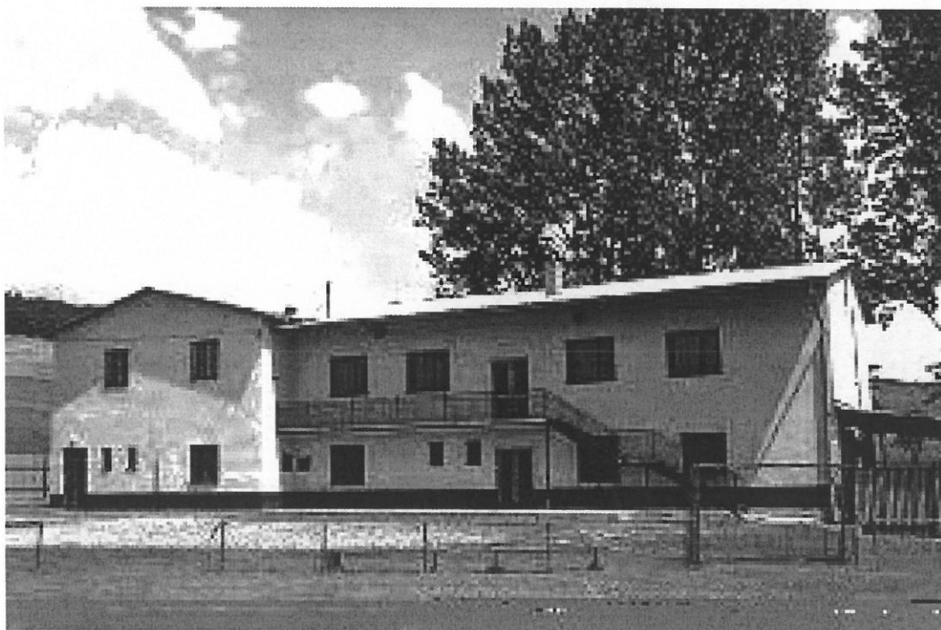
Kultúrny dom v obci Kružná

Kultúrny dom v Kružnej bol skolaudovaný v roku 2000 pri príležitosti I. Dňa obce.