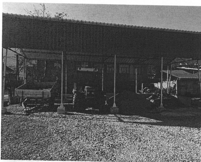
Parkovisko pre obecný traktor a autobus