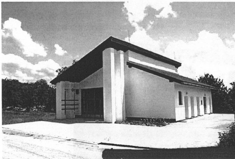
Dom smútku v obci Kružná

Z novších stavieb občanom slúžia budova kultúrneho domu a dom smútku. Stavba Domu smútku bola začatá v roku 1995. Dom smútku bol uvedený do prevádzky len v roku 1998. Kolaudácia stavby bola v roku 2009. Slávnostné odovzdanie Domu smútku do užívania sa uskutočnilo dňa 1. augusta 2009 pri príležitosti V. Dňa obce Kružná.