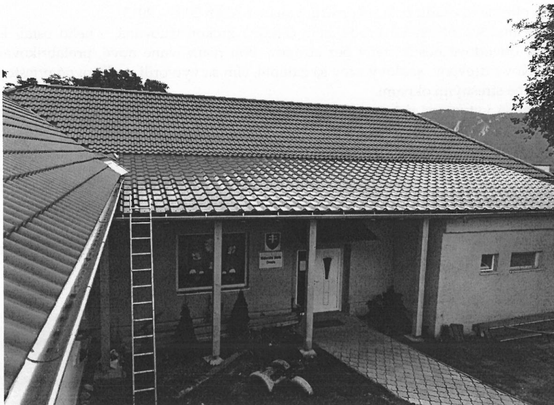
Materská škôlka v Kružnej