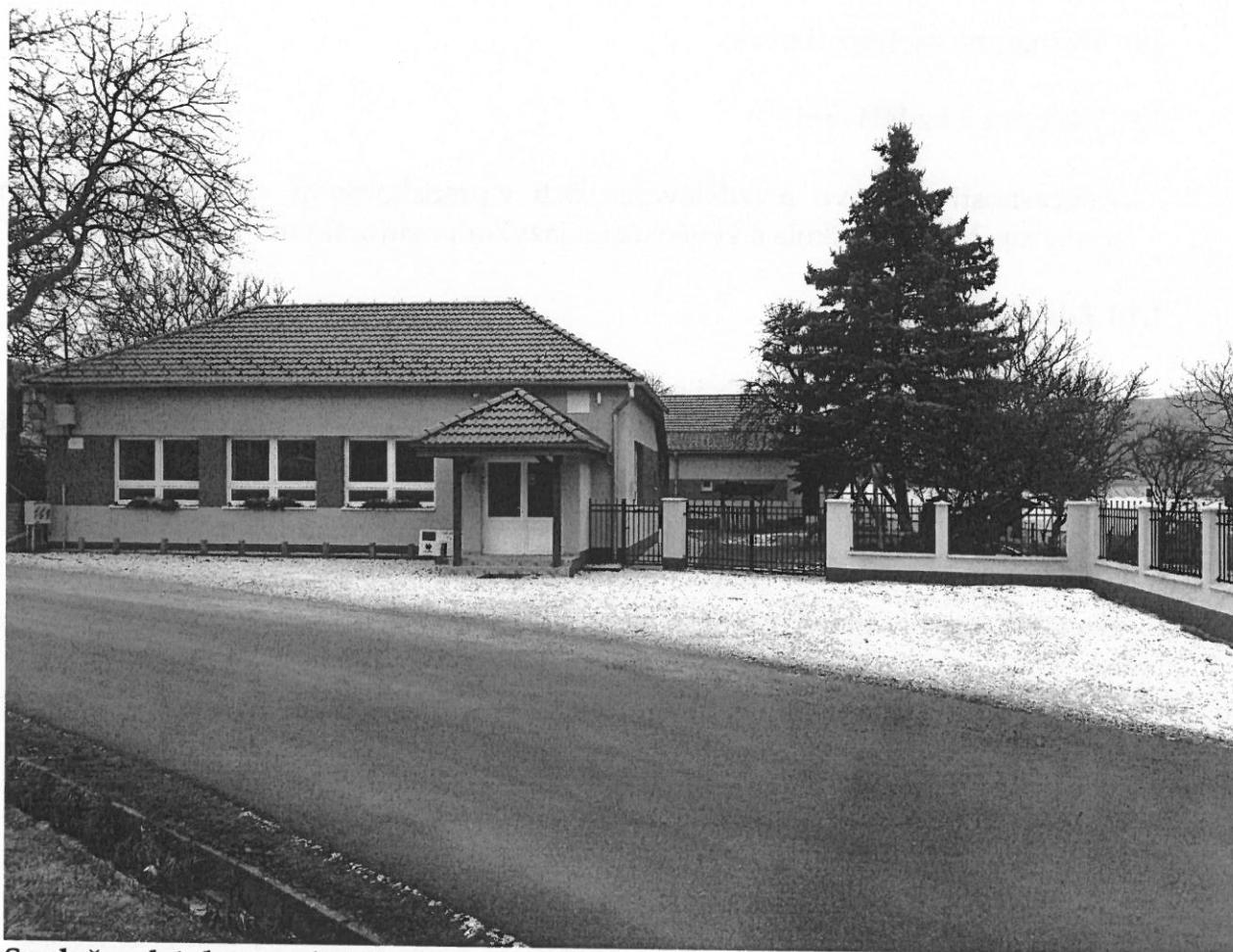
Spoločenský dom v obci Kružná

V blízkosti obce sa nachádza malá vodná nádrž, ktorá je obľúbeným rybárskym revírom.