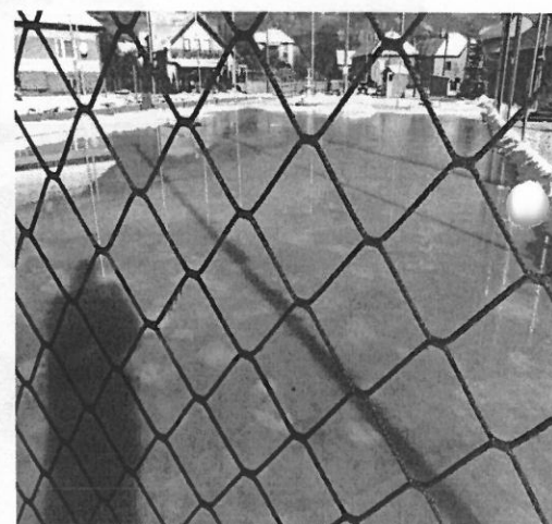
Detské ihrisko s hracími prvkami a multifunkčné ihrisko s umelým trávnikom na futbal, nohejbal a volejbal a v zime na korčuľovanie a na hokej.