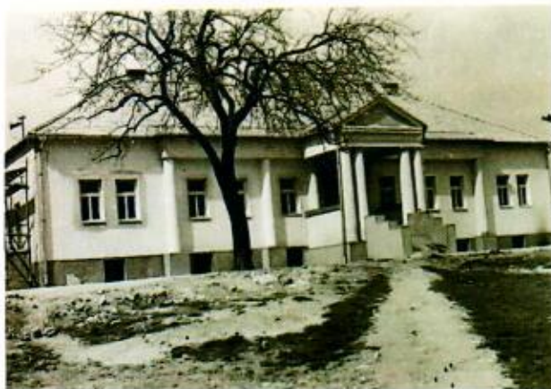
4.7. Pamiatky: Kúria klasicistická z polovice 19. Storočia

poľnohospodárstvom. V rokoch 1938-1944 bola obec pripojená k Maďarsku. Počas okupácie tu pracovala ilegálna skupina. Roku 1947 sa sem prisťahovalo viacero slovenských rodín z Maďarska. JRD bolo založené v r. 1952.