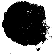
Odbitok pečatle z r. 1859