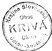
Odbitok pečate obce z r. 1935