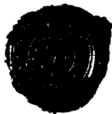
Odbitok obecnej pečatle z r. 1842