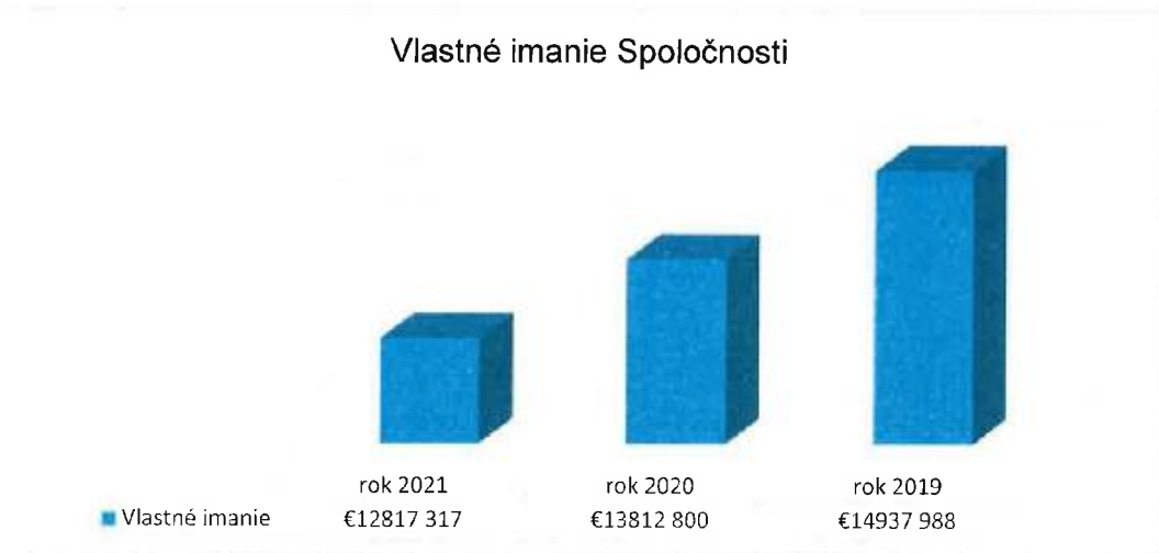
Graf č. 2: Vývoj vlastného imania Spoločnosti za obdobie rokov 2019 – 2021