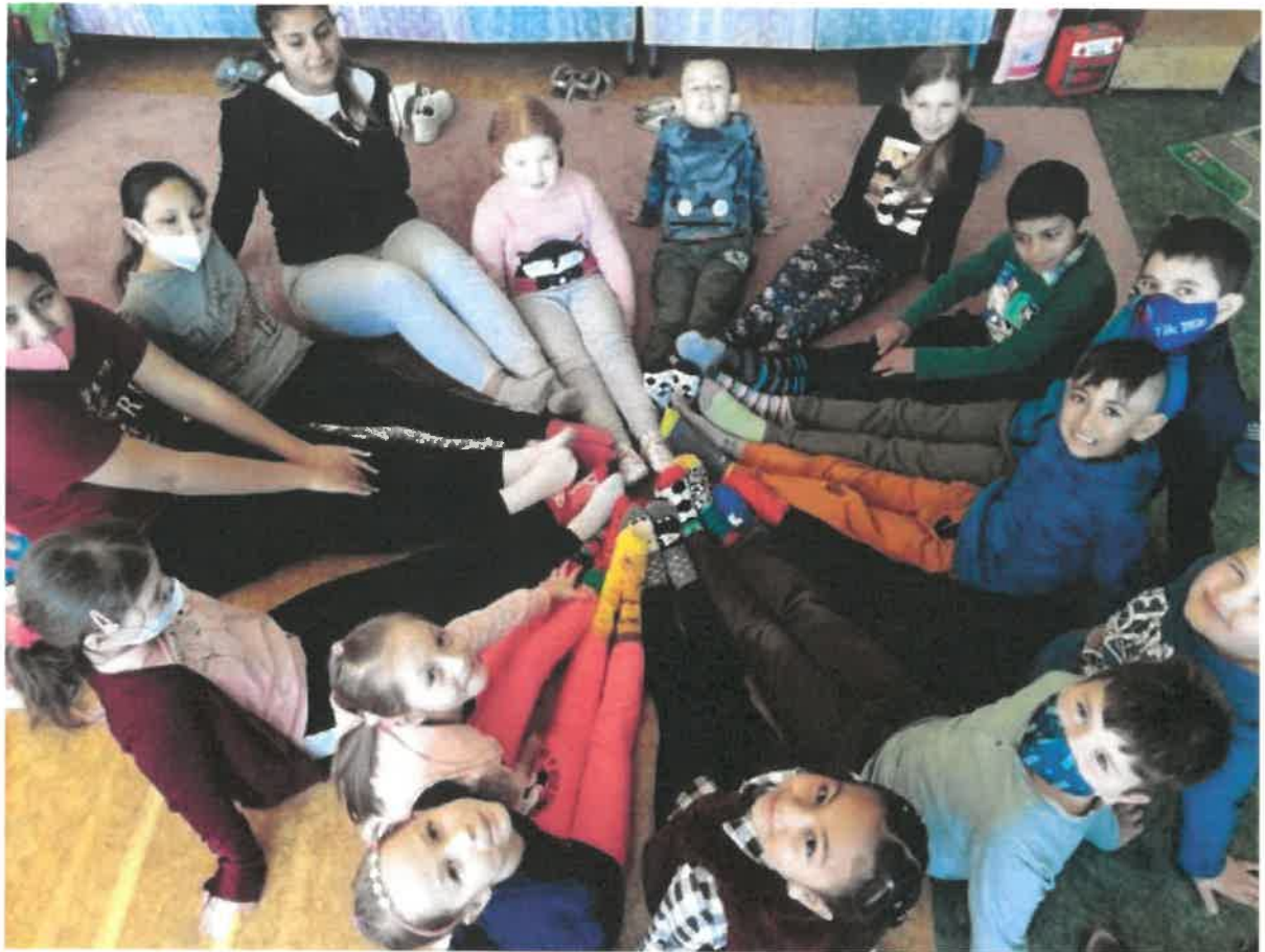
- Materská škola Iľiašovce