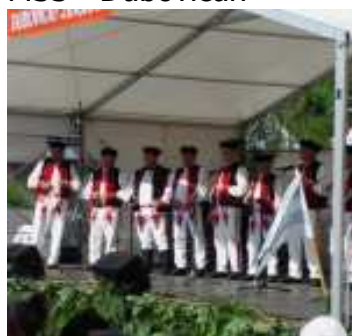
MSS - Dubovičan