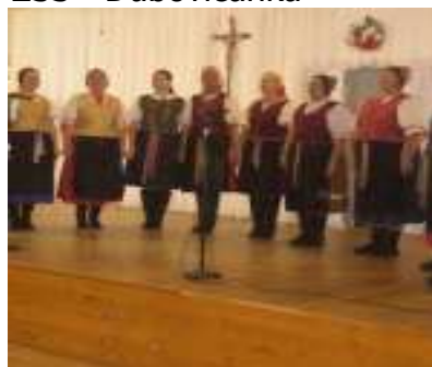
ŽSS - Dubovičanka