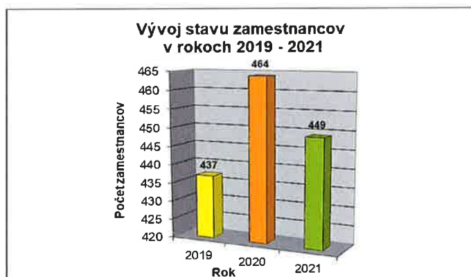
Graf č.2: Vývoj stavu zamestnancov v rokoch 2019 – 2021

Od roku 2005 sa Spoločnosť podieľa na výdavkoch výskumu a vývoja. Medzi významné projekty patrí projekt T7 pre zákazníka PEUGEOT CITROËN (STELLANTIS). V ďalších rokoch to bol projekt DV Euro6 pre zákazníkov FORD a PSA. Ďalej sa Spoločnosť venovala validácii strojov a zariadení pre projekt DV5R určený pre zákazníka PSA. Okrem toho možno spomenúť projekty Orhan Morocco a BVH2. V roku 2020 Spoločnosť celkovo vynaložila 322 tis. EUR na validáciu strojov a zariadení pre projekty určené zákazníkovi RENAULT a PEUGEOT CITROËN. Výskumná a vývojová činnosť sa realizuje v sesterskej spoločnosti Nobel Plastiques SAS, Francúzsko.