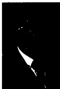
Michal Petrilák Volebný obvod č. 1