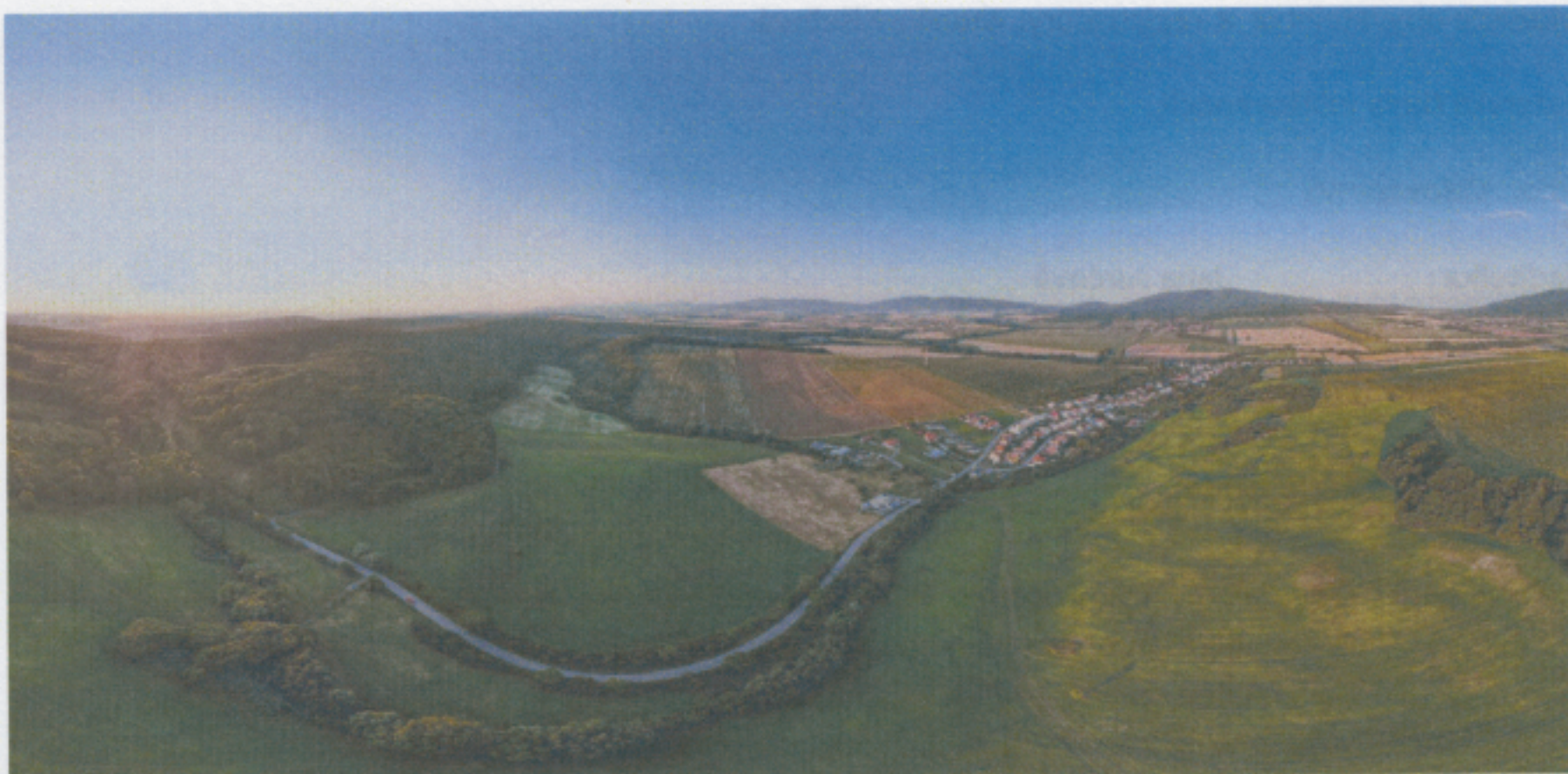
obec Olšovany – príjazd od Košíc