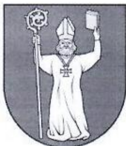
Erb obce Tekovské Lužany