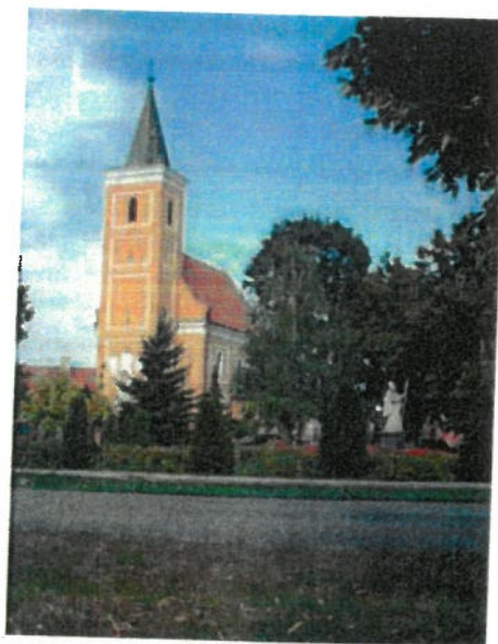
Obrázok 2 Kostol sv. Mikuláša