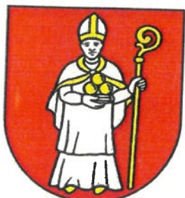
Obrázok 5 Erb obce Tomášov

Symbolmi obce sú erb, vlajka a pečať. V červenom štíte je biskup - svätý Mikuláš - v striebornom zlatolemom rúchu, v pravici pred sebou s tromi zlatými guľami na striebornej položenej knihe, v ľavici so zlatou berlou.