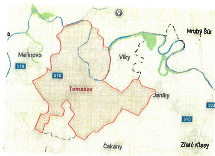
Obrázok 7 Geografická poloha obce Tomášov