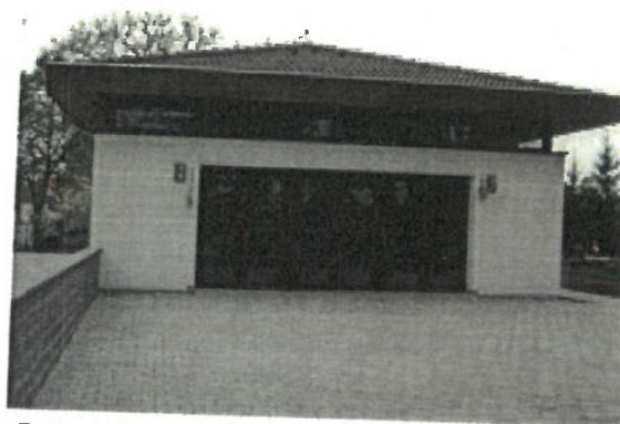
Obrázok 4 Kaplnka sv. Kríža