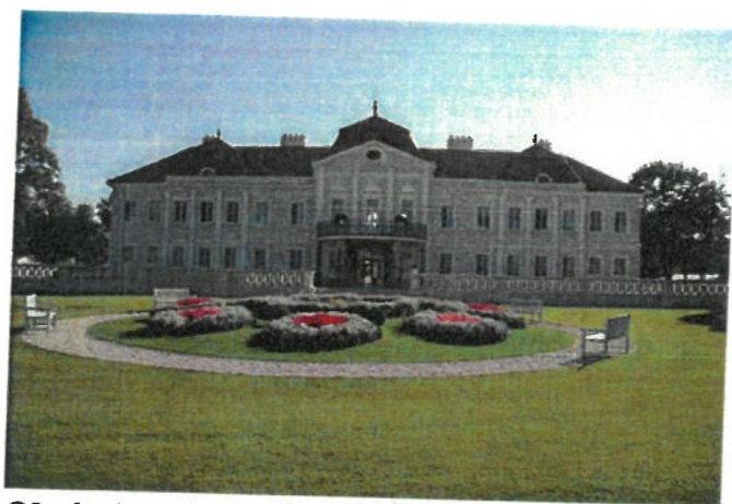
Obrázok 1 Barokový kaštieľ Majorháza

Za budovou barokového kaštieľa bol založený park na počesť kráľovnej Alžbety nazývaný ako Alžbetina záhrada. Ide o rozsiahly a pomerne dobre zachovaný anglický park.