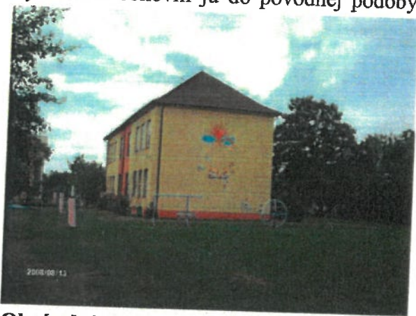
Obrázok 3 Budova pôvodnej ľudovej školy

Kaplnka sv. Kríža je neogotická stavba z konca 19. storočia. Okolo roku 1965 vyhorela a obnovili ju do pôvodnej podoby. Kaplnka v súčasnosti slúži ako dom smútku.