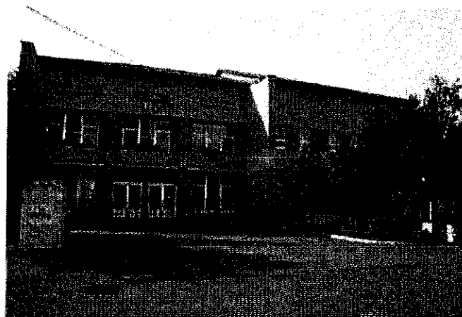
KOSTOL SV. ŠTEFANA KRÁĽA A KULTÚRNY DOM V BISKUPICIACH