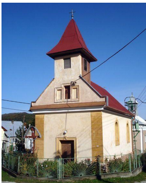
Kaplnka sv. Antona Padánskeho – kaplnka z roku 1903