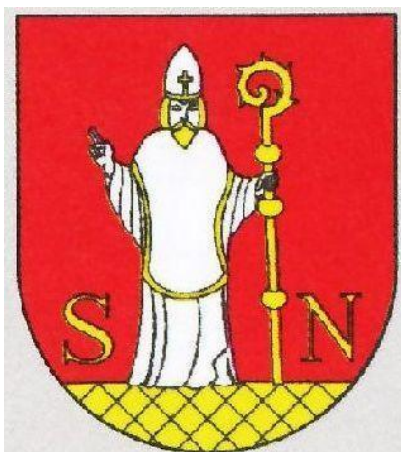
Vlajka obce :