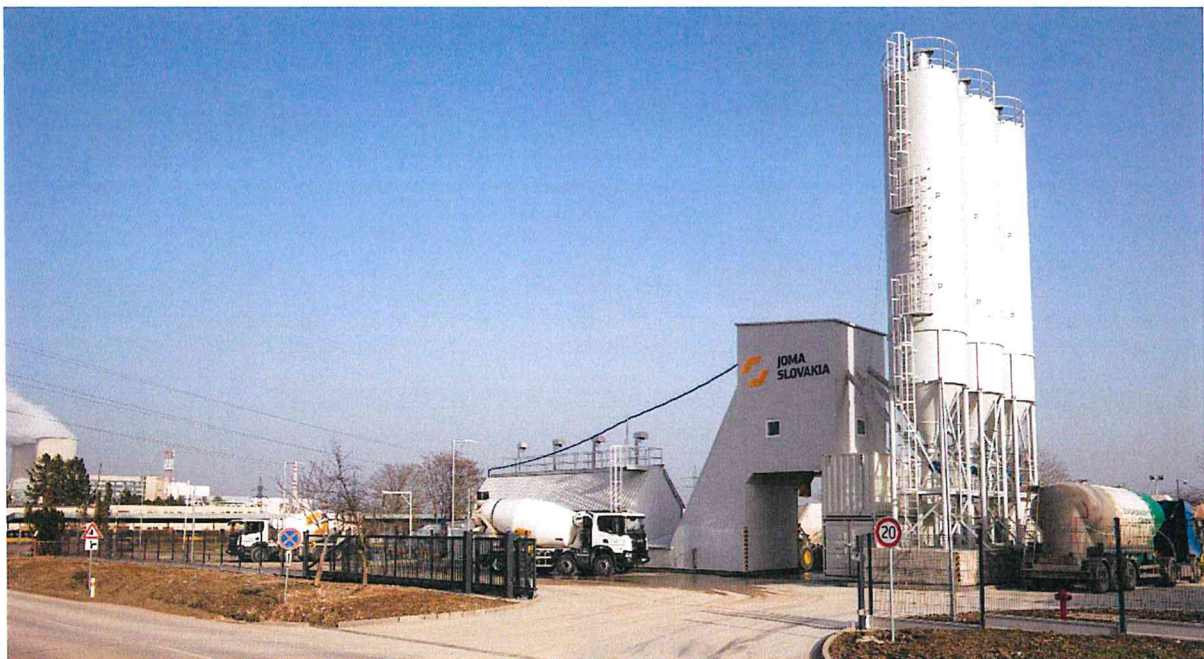
Obrázok 1 Aktuálny náhľad betonárky

Dopravu a čerpanie betónu považujeme za kľúčovú časť nášho výrobného - dodávateľského procesu. Na dopravu používame autodomiešavače s objemom až 9 m 3 betónovej zmesi. Čerpanie betónu zabezpečujeme čerpadlami s dosahom až 48 m. Základnými kameňmi našej filozofie pri výrobe betónu sú kvalita, odbornosť a spoľahlivosť.