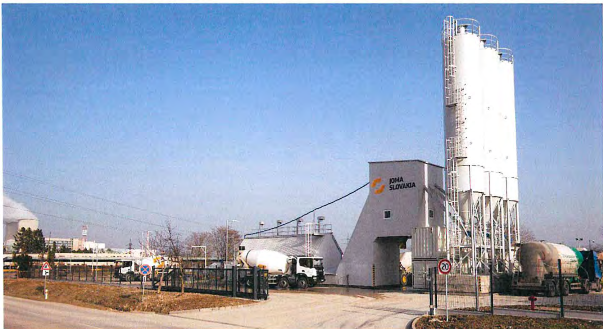
Obrázok 1 Aktuálny náhľad betonárky

Dopravu a čerpanie betónu považujeme za kľúčovú časť nášho výrobného - dodávateľského procesu. Na dopravu používame autodomiešavače s objemom až 9 m 3 betónovej zmesi. Čerpanie betónu zabezpečujeme čerpadlami s dosahom až 48 m. Základnými kameňmi našej filozofie pri výrobe betónu sú kvalita, odbornosť a spoľahlivosť.