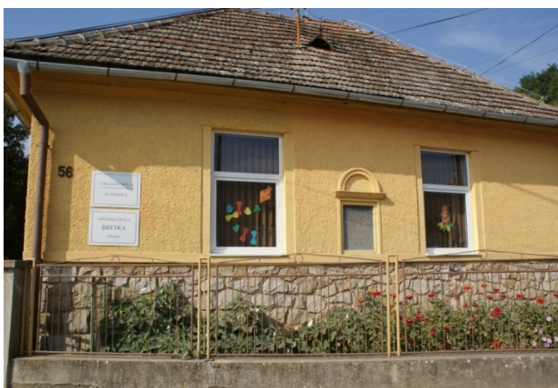
Budova školy a škôky

Na základe analýzy doterajšieho vývoja možno očakávať, že rozvoj vzdelávania sa bude orientovať na skvalitňovanie výchovno – vzdelávacieho procesu.