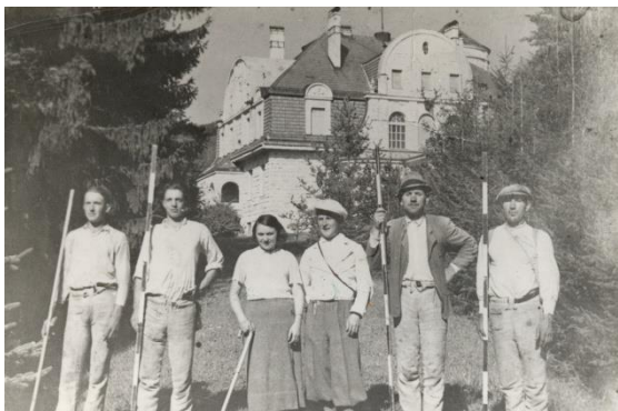
Pohľad na kaštieľ na Blatinách pred I. sv.vojnou