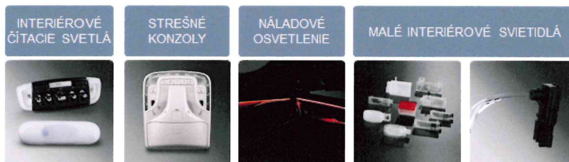
Obrázok 2A: Produktové portfólio spoločnosti Hella Innenleuchten - Systeme Bratislava, s.r.o.

Úlohou výroby v uplynulom obchodnom roku bolo popri priebežnom plnení zákazníckych potrieb v osvedčenej kvalite zabezpečiť aj dostatočnú zásobu hotových výrobkov, aby pri relokácii nedošlo k ohrozeniu plnenia voči zákazníkom. Aj napriek miestami kritickej situácii na trhu s elektronickými komponentami prebehla relokácia pri väčšine projektov úspešne.