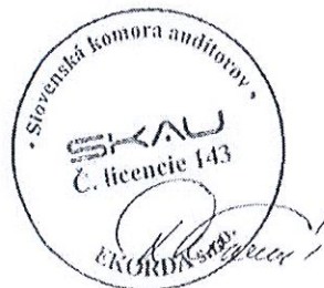
E K O R D A, s.r.o. Révová 45, Bratislava Licencia SKAU 143