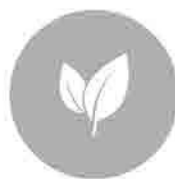
životné prostredie, biomasa