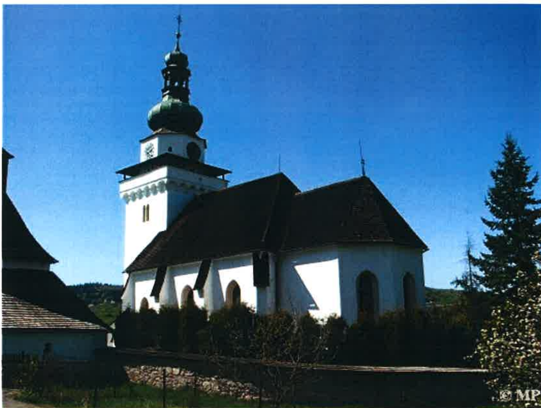
Rímskokatolícky farský kostol sv. Jána apoštola a evanjelistu.

Najvýznamnejšou dominantou a bezpochyby aj najstaršou budovou obce je rímskokatolícky farský kostol sv. Jána apoštola a evanjelistu. Bol vybudovaný v polovici 13. storočia v neskororománskom slohu a orientovaný je v smere východ - západ, so svätyňou na východ. Podľa najnovšieho schematizmu bol vysvätený pravdepodobne v roku 1243.