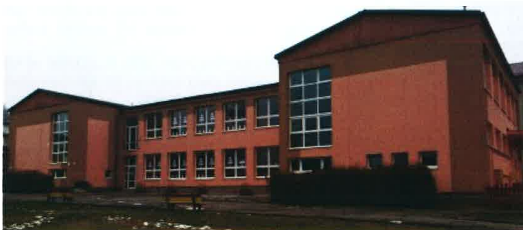
Základná škola s Materskou školou

Najstaršou budovou, okrem kostolov a kaplniek, je v Banskej Belej budova školy, nad krytým schodišťom, vedúcim ku kostolu. Na tejto budove je zachovaný plastický kamenný banický erb s letopočtom 1564. Budova, pôvodne renesančná, s neskoršími stavebnými úpravami, má v prízemí zo schodišťa vchod do pôvodnej školskej triedy, v ktorej sa zachovala ešte pôvodná renesančná hrebienková klenba. V hornom podlaží bol byt pre učiteľa a organistu. Budova slúžila pre školské účely do roku 1868. Okrem historických objektov sa v obci nachádzajú aj dve novodobé školské budovy, konkrétne budova materskej škôlky a základnej školy, nachádzajúcej sa neďaleko farského kostola a cintorína.