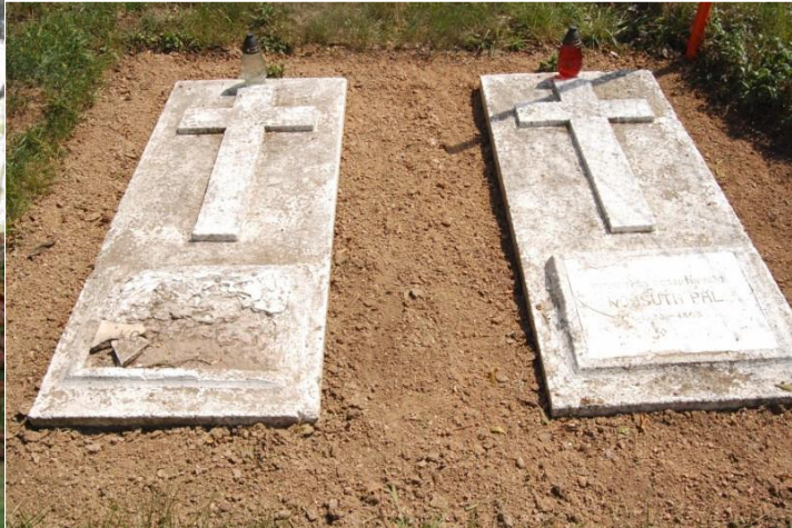
Obrázok 8 Hrobka rodiny Pavla Kossutha