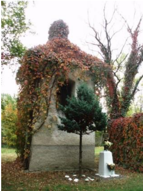
Obrázok 7 Zvonička

Pri kostole stojí jednoduchá murovaná zvonica na pôdoryse štvorca so segmentovo V areáli terajšieho obecného úradu sa nachádza hrobka zemepánov Kossuthovcov.