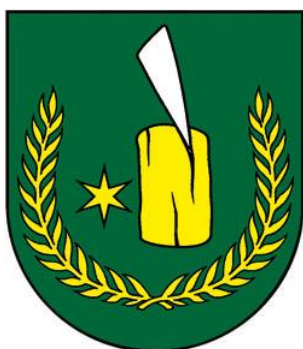
Obrázok 3 Erb obce Klin nad Bodrogom