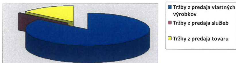
Tržby z predaja vlastných výrobkov, služieb a tovaru za rok 2021

Z najvýznamnejších položiek nákladov výsledok hospodárenia ovplyvnili: výrobná spotreba (materiál, energie, služby) 1 248 883 EUR ( v roku 2020: 1 129 738 EUR), osobné náklady (mzdy, sociálne poistenie, sociálne náklady) 1 069 799 EUR (v roku 2020: 1 033 838 EUR), náklady vynaložené na obstaranie predaného tovaru 374 028 EUR (v roku 2020: 97 332 EUR), odpisy k dlhodobému hmotnému a nehmotnému majetku 205 335 EUR (v roku 2020: 200 502 EUR).