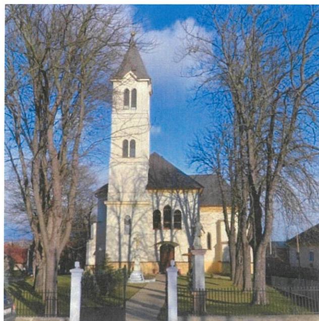
Rímskokatolícky kostol v Períne

Rímskokatolícky kostol sv. Štefana v Chyme - jednod'ová gotická stavba so segmentovým ukončením presbytéria a predstavanou vežou z konca 13. storočia.