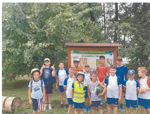
Účastníci futbalového kempu na výlete