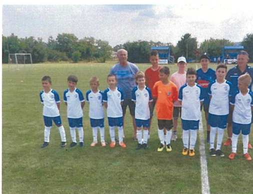
Ukončenie futbalového kempu

Obecný futbalový klub Perín organizoval v mesiaci júl týždenný športový futbalový kemp pre deti a mládež na miestnom futbalovom ihrisku s profesionálnymi trénermi a nabitým programom. Futbalový kemp ukončili v sobotu akciou „Športový deň“, ktorá bola pre všetkých občanov. Futbal si zahrali deti, mládež, A – mužstvo a následné aj „horný koniec“ proti „dolnému koncu“.