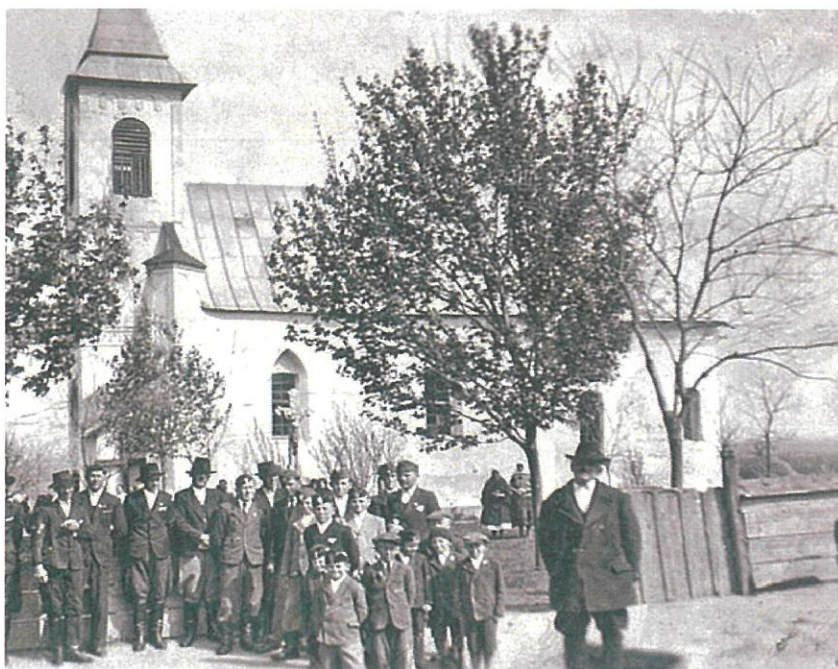
Chymský rímskokatolícky kostol sv. Štefana Uhorského okolo roku 1940

Rímskokatolícky kostol sv. Štefana v Chyme - jednod'ová gotická stavba so segmentovým ukončením presbytéria a predstavanou vežou z konca 13. storočia.