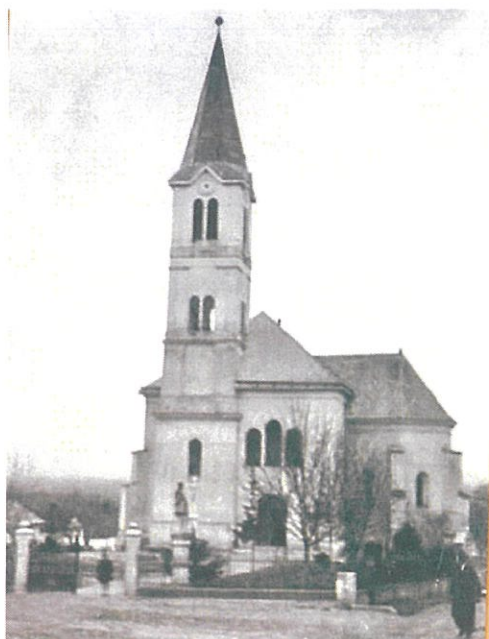
Rímskokatolícky kostol v Períne okolo roku 1941