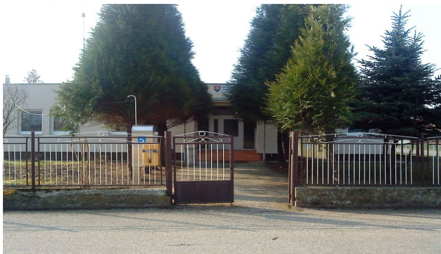
Budova Obecného úradu