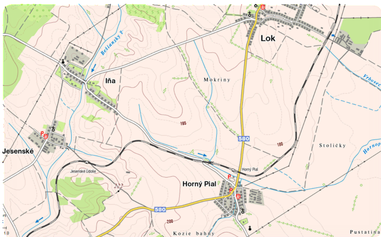
Lokalizácia obce v rámci okresu