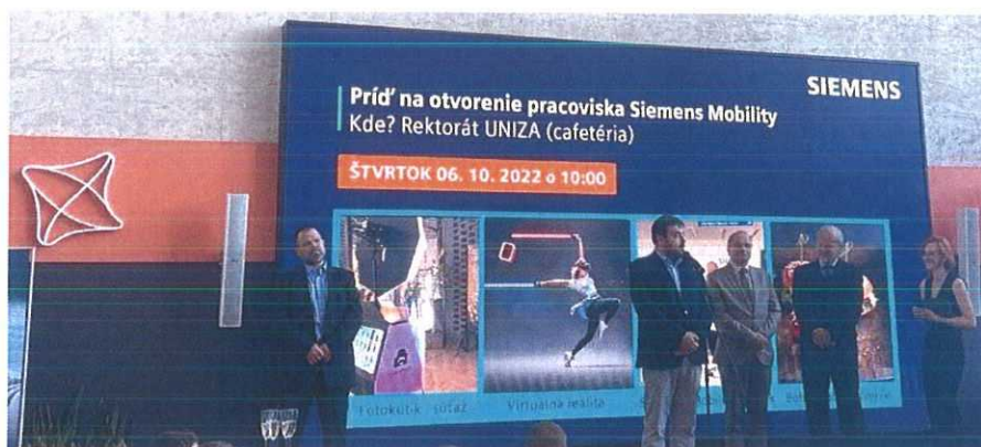
Slávnostné otvorenie Centra inovatívnej spolupráce na Žilinskej univerzite