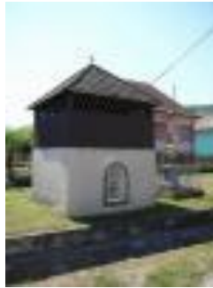
Obr. 4 Zvonica