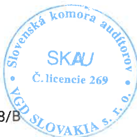
Zodpovedný audítor Bart Waterloos Licencia UDVA č. 1029

VGD SLOVAKIA s. r. o. Moskovská 13 811 08 Bratislava Obchodný register, zložka 74698/B Licencia SKAU č. 269