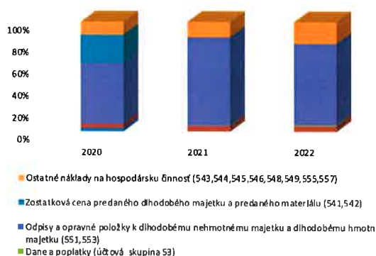
Náklady na hospodársku činnosť spolu

Najväčší podiel nákladov na hospodársku činnosť tvoria odpisy vo výške 153 tis. EUR.