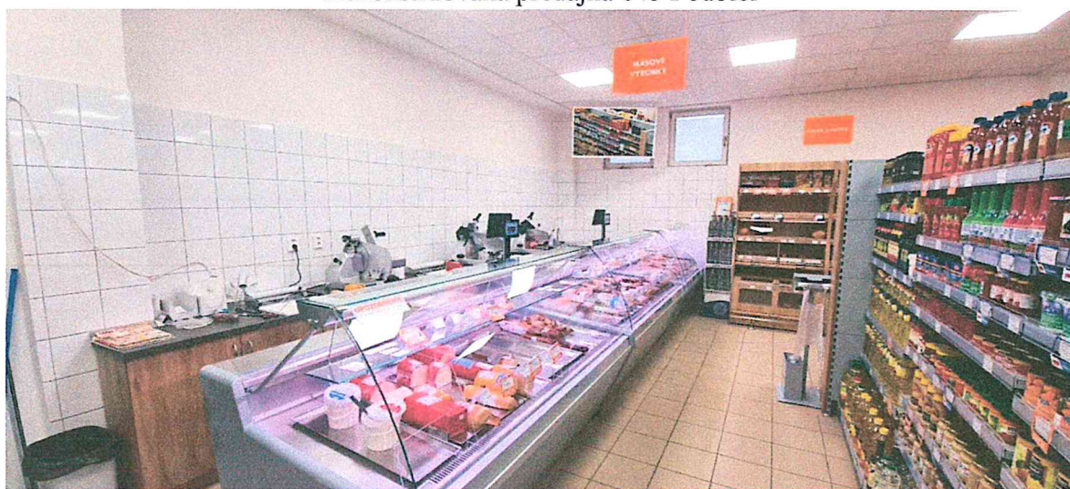
Rekonštruovaná predajňa 045 Podbiel'

Družstvo v roku 2022 rekonštruovalo predajňu v Podbieli, kde zväčšilo predajné priestory, čím sa zvýšil komfort nakupovania pre zákazníkov. Bola prevedená celková výmena zariadenia v cene 93 549 €. Predajňa bola zaradená do formátu supermarket III. Mimo rekonštrukcie v Podbieli sa previedla výmena okien v OD Trstená, zrekonštruovala sa fasáda, čím došlo k úspore nákladov na vykurovanie.