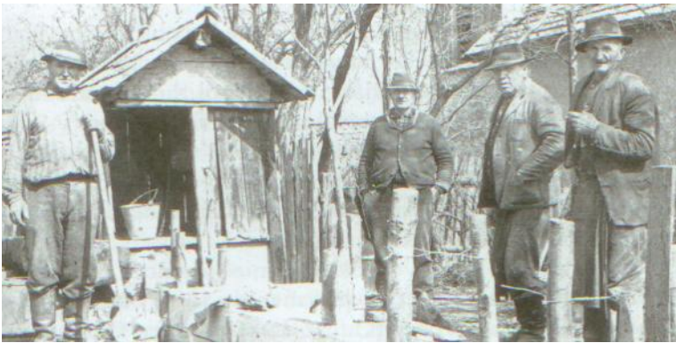
Muži z Kocel'oviec v pracovnom oblečení