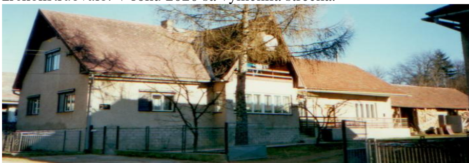
Budova novej fary