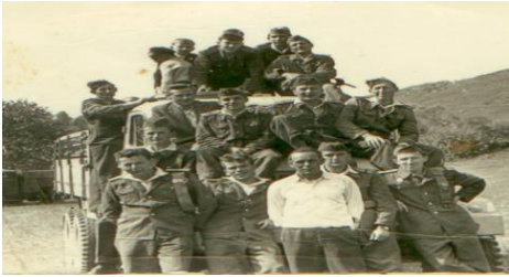
Dobrovoľný hasičský zbor z roku 1959