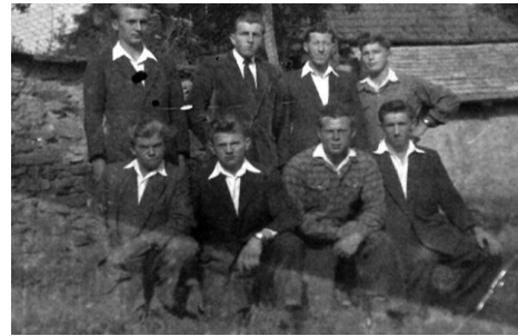
Táto fotografia vznikla okolo roku 1960 vidíme na nej osem členov Dobrovoľného hasičského zboru

Družstvo dobrovoľného hasičského zboru obce Kocel'ovce sa v roku 2013 zúčastnilo nasledovných pretekov pripravenosti DHZ, na ktorých sa zúčastnili družstvá muži a ženy: