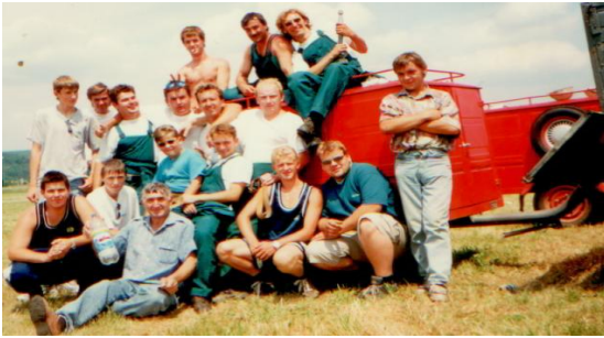
Dobrovoľný hasičský zbor z roku 2002